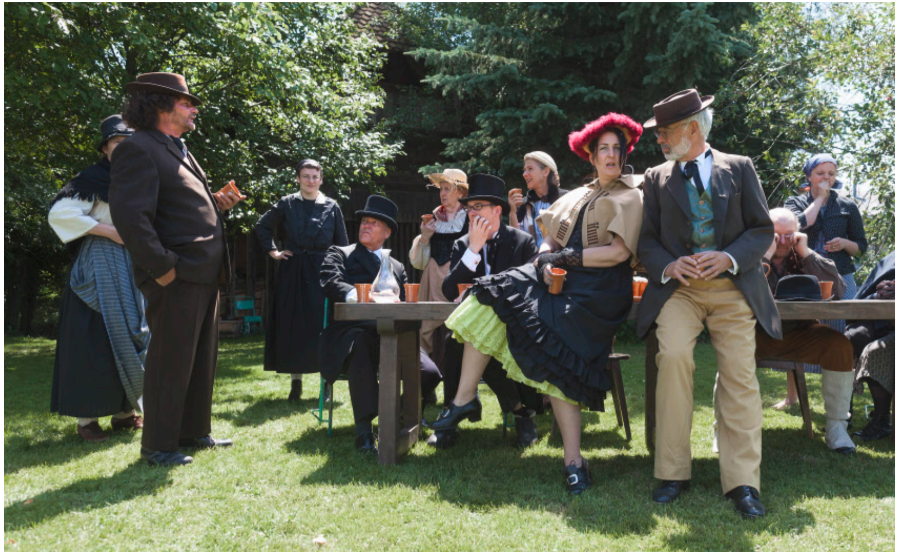
Die Idylle trügt: In der stieren Dorfgesellschaft kann Vrenelis und Salis Liebe nicht gedeihen.

Mit Jeremias Gotthelf hat «Romeo und Julia auf dem Dorfe» genau genommen rein gar nichts zu tun. Es basiert auf der gleichnamigen Novelle von Gottfried Keller. Im Mittelpunkt steht die tragische Liebesgeschichte von Sali und Vreneli, den Kindern zweier verfeindeter Familien. Als ihre Aussicht auf eine gemeinsame Zukunft zerstört wird, sieht das Paar keinen anderen Ausweg,