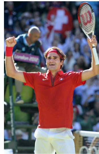
Roger Federer nach seinem Halbfinalsieg bei Olympia.